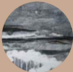
2009. Paisatge metafòric II Rafael Lamas