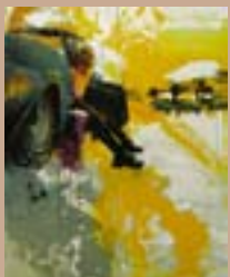
2008. Kaf'ak Pere Vilardebó